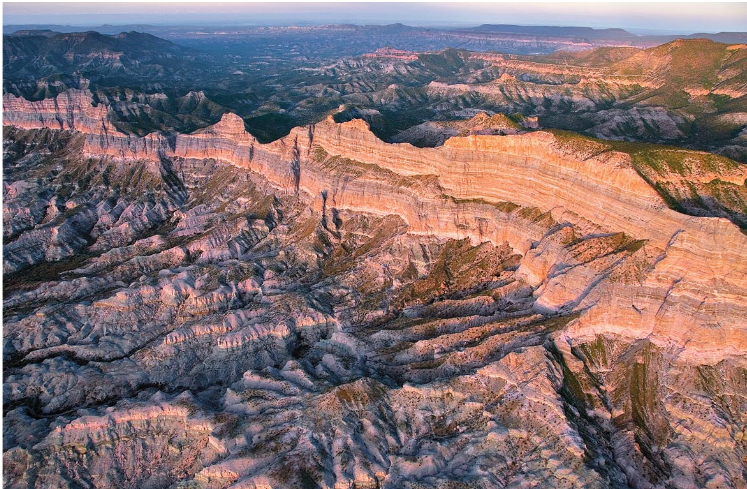
Estribaciones de Sierra de La Giganta, Baja California Sur

LOS DE MI GENERACIÓN CRECIMOS CON UN PARADIGMA que orientó nuestro pensamiento durante décadas: el de las tierras ociosas. En un mundo donde hay hambre y carencias, aprendimos, ¿cómo justificar mantener tierras alejadas de la producción? Durante mi adolescencia y mi juventud, el desmonte, el avance de las fronteras agrícolas, y la expansión urbana sobre bosques y selvas, eran sinónimo de progreso, de pujanza, de un crecimiento económico que traería tras de sí una mayor riqueza y una mejor justicia distributiva. Las tierras silvestres estaban allí, dictaba el pensamiento dominante de entonces, para nuestro progreso como sociedad. Era sólo necesario conservar algunas pocas en estado natural para el goce de cazadores o el disfrute de campistas y exploradores aficionados. Lo demás, era parte del progreso, parte del desarrollo del México moderno.