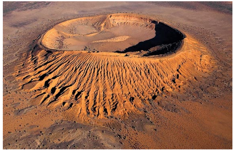
Vista aérea del cráter del Cerro Colorado en la Reserva de la Biosfera El Pinacate y Gran Desierto de Altar, Sonora