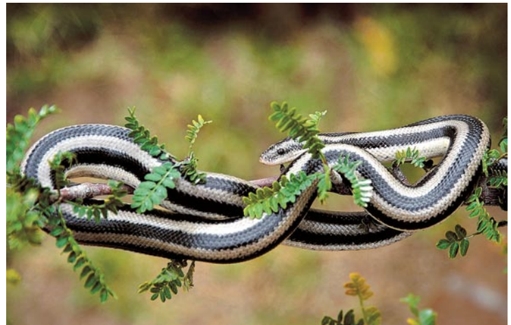
Boa rosada, Sierra La Giganta, Baja California Sur