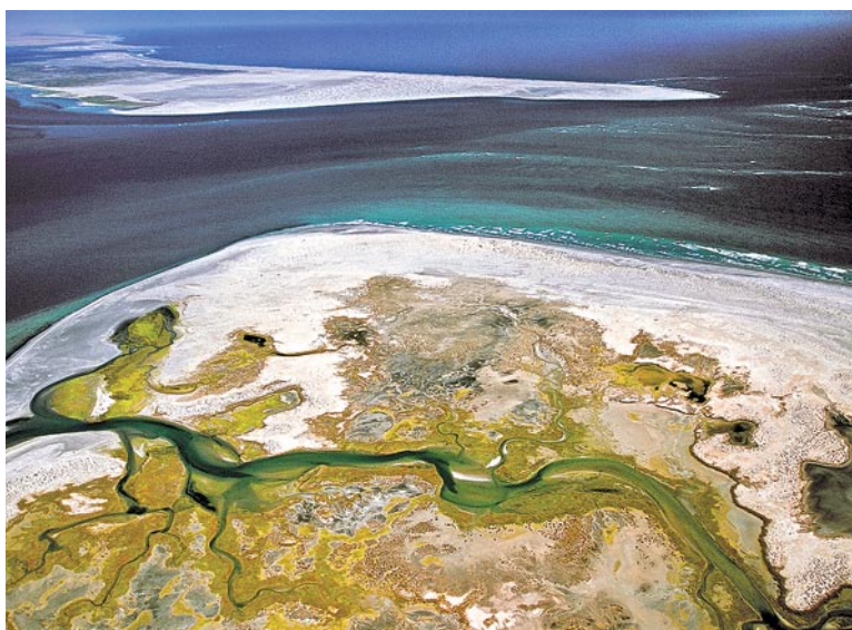
Estero La Bocana en Laguna San Ignacio, El Vizcaíno B.C.S. Vista aérea

Eduardo Galeano escribió, en un texto denominado “Ventana sobre la utopía”, un pensamiento que describe esta meta que nos hemos planteado: “Ella está en el horizonte. Me acerco dos pasos, ella se aleja dos pasos. Camino diez pasos y el horizonte