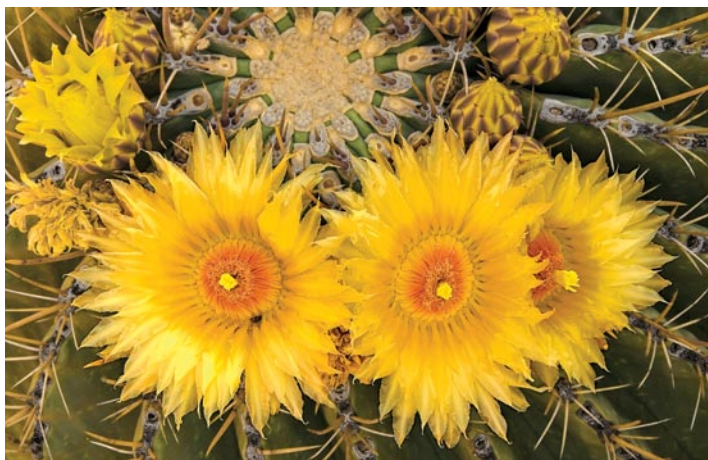
Flor de biznaga en la Sierra de Guadalupe, Baja California

“La geografía de la esperanza”... He atesorado mentalmente ese concepto durante décadas, sobre todo cuando, como ambientalista, me ganaba la desesperación al ver ecosistemas naturales sucumbir bajo la depredación de corto plazo, siempre bajo el argumento del desarrollo: acuíferos agotados, selvas taladas, laderas erosionadas, lagunas costeras dragadas, arrecifes deteriorados, pesquerías colapsadas.