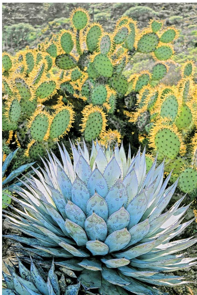
Magüey primavera y cholla, Isla Cedros, Baja California

Fue hasta unos años después que leí aquella conmovedora carta al Director de Parques Nacionales de los Estados Unidos, escrita por Wallace Stegner, uno de los más grandes escritores de naturaleza del siglo XX, en la que argumentaba sobre las muchas razones que hay para conservar el medio silvestre. El autor cerraba su carta con este maravilloso párrafo: "Necesitamos poner en marcha, para la preservación del medio silvestre, principios distintos a los de la explotación, el uso productivo, o incluso la recreación. Simplemente, necesitamos ese paisaje silvestre, aún si nunca hacemos más que verlo de lejos, porque puede ser una forma de reasegurarnos a nosotros mismos de nuestra cordura como criaturas, una parte de la geografía de la esperanza."