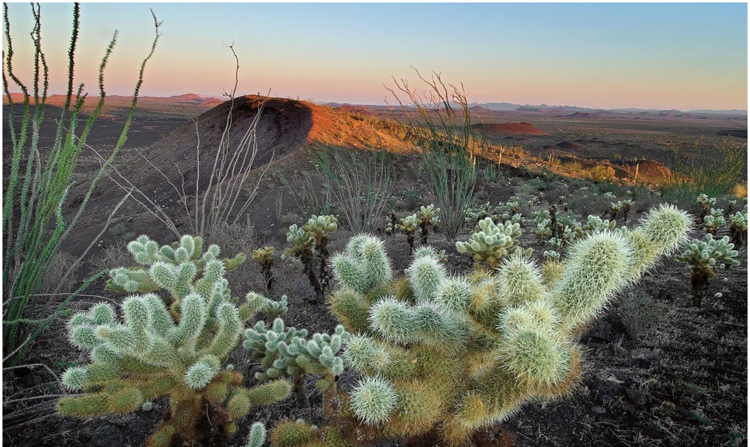
Salida del sol en la cumbre del cráter Tecolote, Reserva de la Biosfera El Pinacate y Gran Desierto de Altar, Sonora