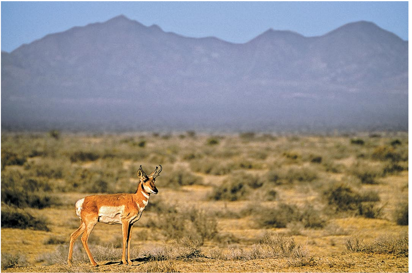
Berrendo en la Reserva de la Biosfera El Vizcaíno, con la sierra San José de Castro al fondo

en el suelo en forma de materia orgánica; nos brindan protección para nuestras costas y estuarios frente al ascenso del nivel del mar y la creciente frecuencia de fenómenos climáticos extremos.