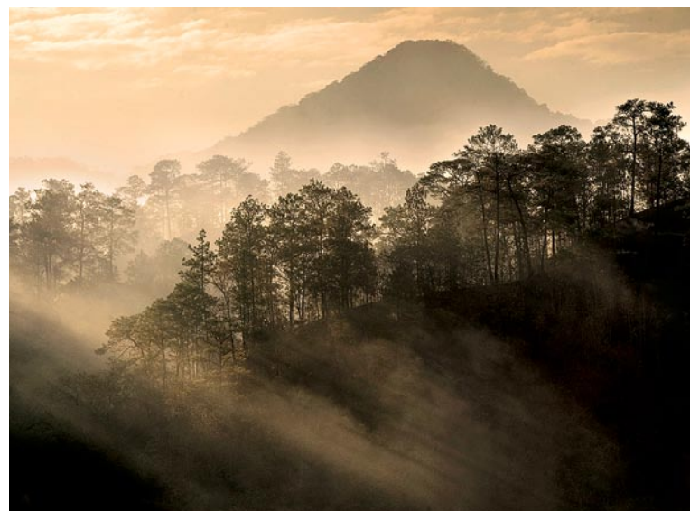
Amanecer en el bosque mesófilo, Reserva de la Biosfera La Sepultura, Chiapas