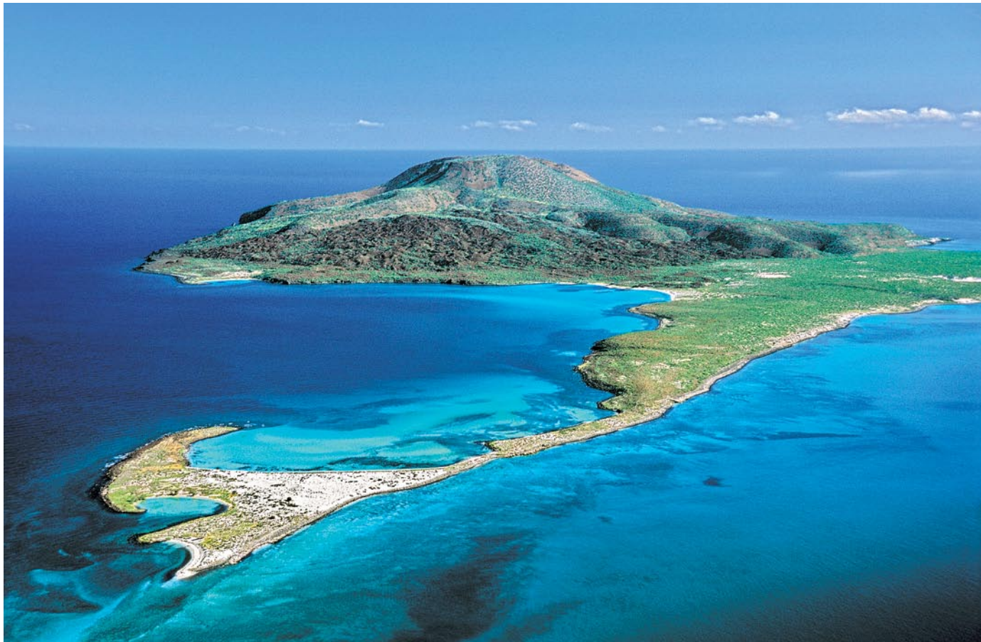
Isla Coronado, Parque Marino Nacional Bahía de Loreto, Baja California Sur